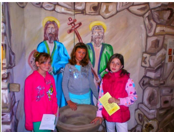
Výstava Cyrila a Metoděje