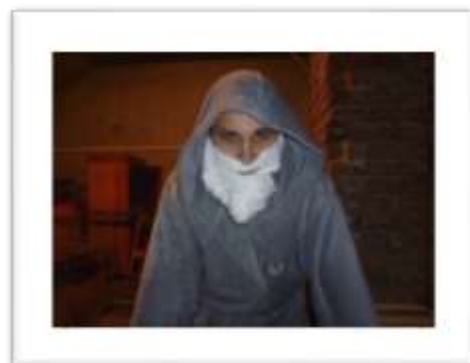
Tým otce Fura