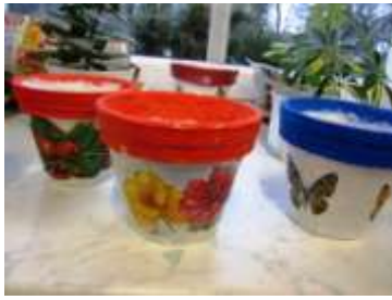
květináče zdobené ubrouskovou technikou