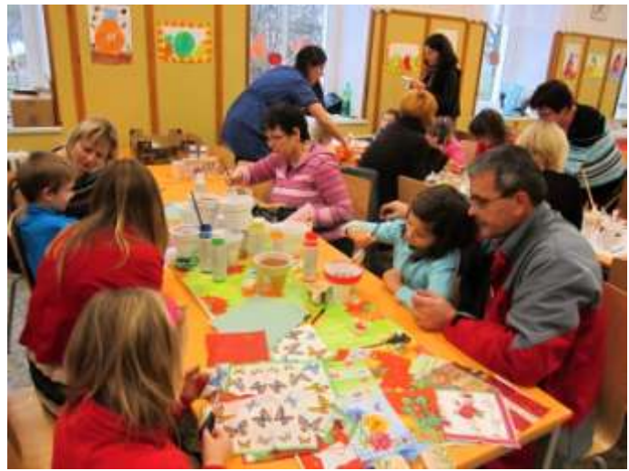
dekorace ze zrníček