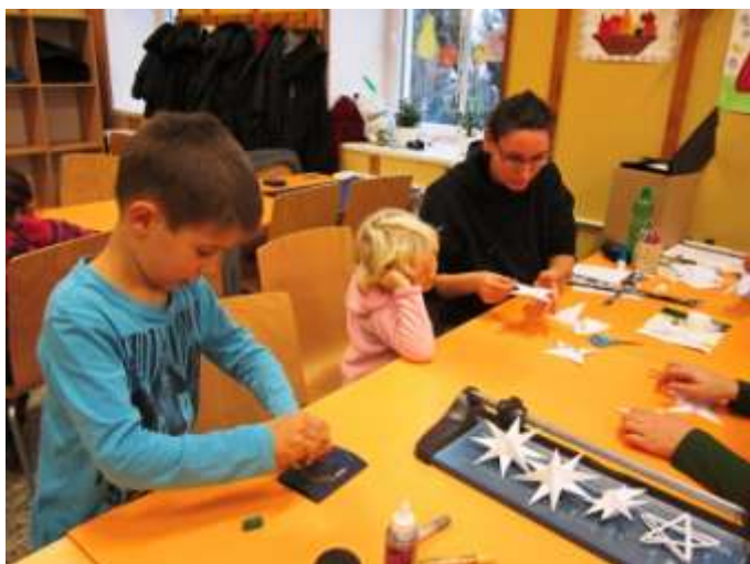
ozdoby z papíru

Ten, kdo našel v sobotu 23. listopadu dvě hodiny volného času, mohl přijít odpoledne ve 14 hodin do školy, kde byly připraveny různé aktivity, a odnést si spoustu vlastnoručně udělaných výrobků. A co si pro vás paní učitelky letos připravily ?