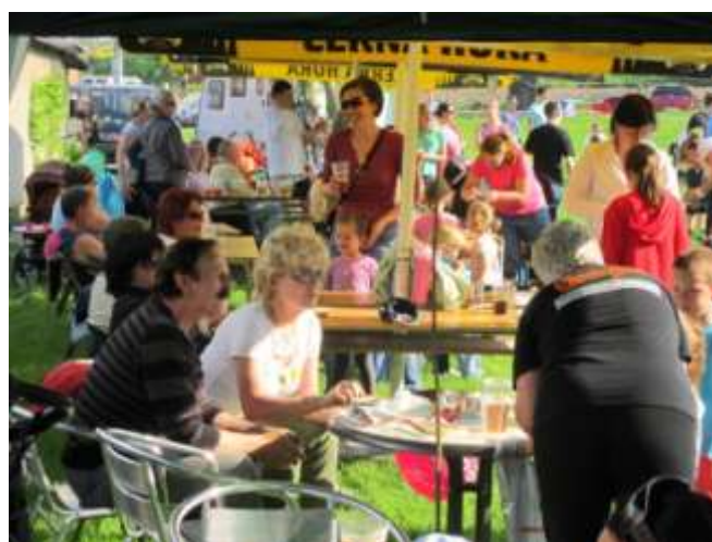
Nechybělo občerstvení i pro rodiče

Počasí nám přálo, a tak jsme díky organizátorům ( KMČ Řepčín a základní škola ) prožili příjemné odpoledne.