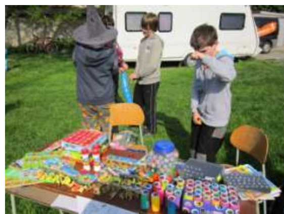
Za 6 razítek na děti čekala v cíli odměna