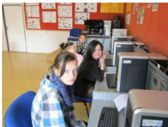
E. Navrátilová – Logické hry na PC