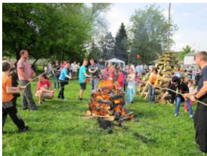
Každé dítě dostalo špekáček, tatínkové se u ohně pěkně zahřáli