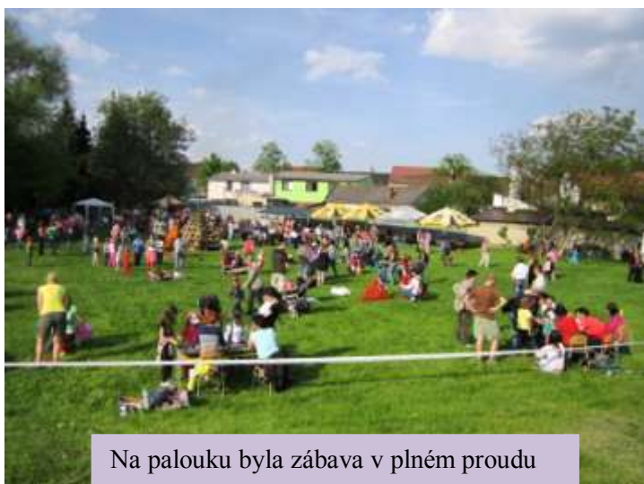
Na palouku byla zábava v plném proudu